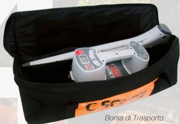
Borsa di Trasporto